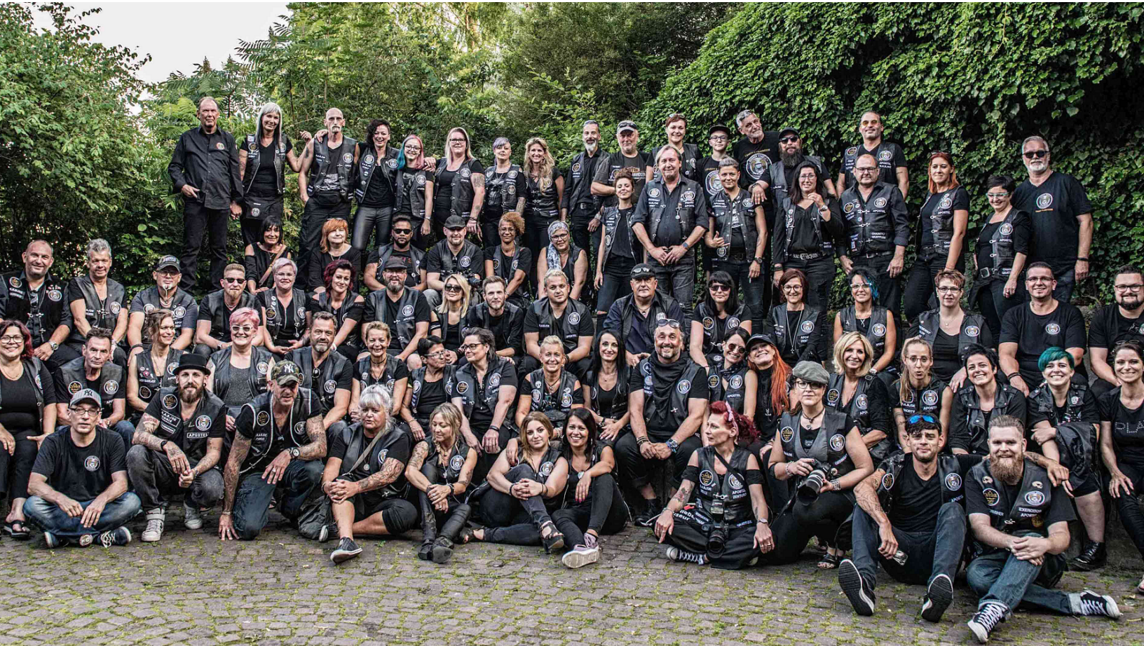
Barber Angels Brotherhood e.V.